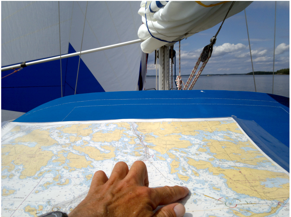
Kartalla ollaan! Kuvaaja: Juha Pasanen, 2014